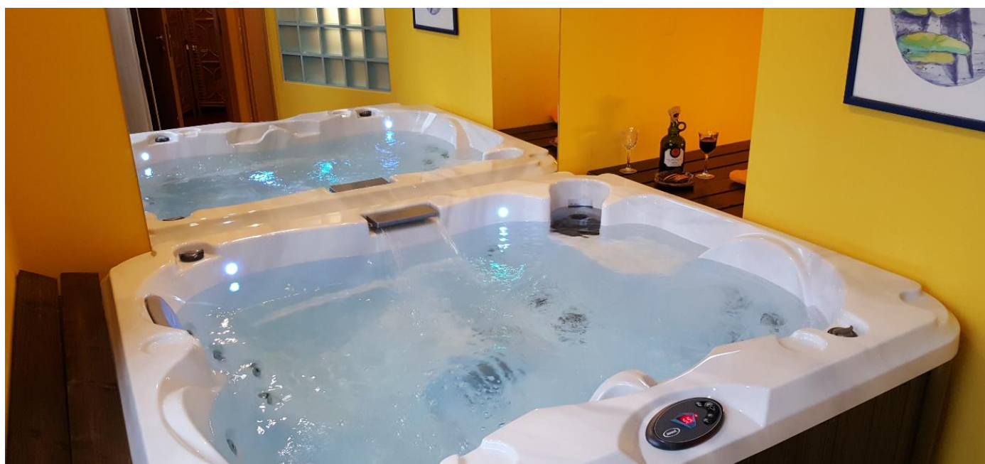
Studio Kapella Novum dla 2 osób, z mini-basenem Jacuzzi®, mini plażą i mini-kominkiem