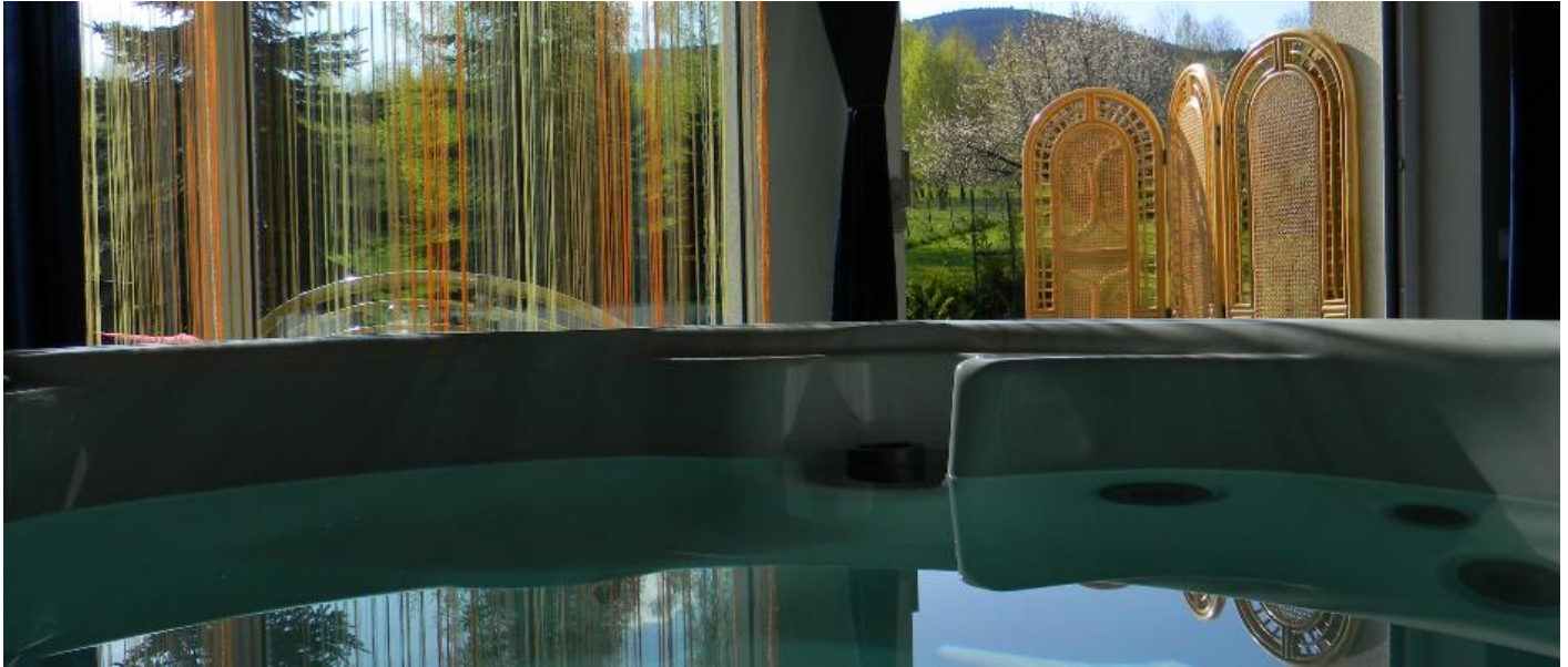
Apartament Andromeda , dla 2 osób, z mini-basenem Jacuzzi® (czterooosobowe okrągłe) i widokiem na Kopę Biskupią, sypialnia, aneks kuchenny, taras,