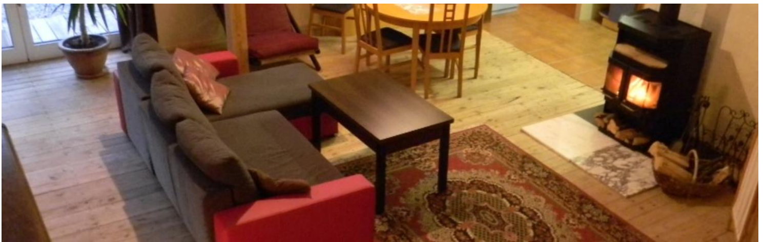
Apartament Kasjopea dla 2 osób, z mini-basenem Jacuzzi® (4osobowym prostokątny), kominkiem, aneksem kuchennym, sypialnią i tarasem