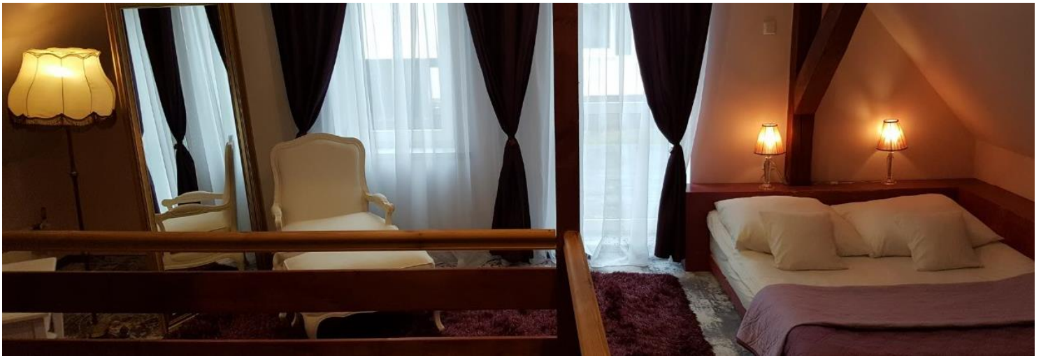
Apartament Luna dla 2 osób, z buduarową sypialnią na poddaszu, aneksem kuchennym, mini-basenem Jacuzzi® (4osobowym kwadratowy), kominkiem i tarasem na parterze.