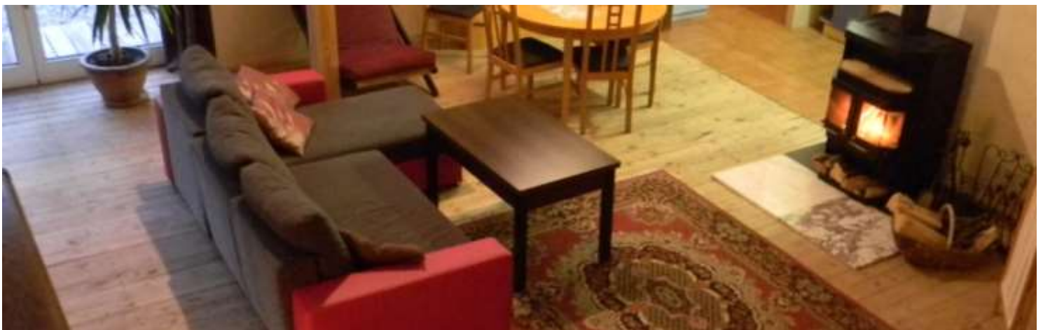
Apartament Kasjoepa dla 2 osób, z mini-basenem Jacuzzi® (4osobowym prostokątny), kominkiem, aneksem kuchennym, sypialnią i tarasem