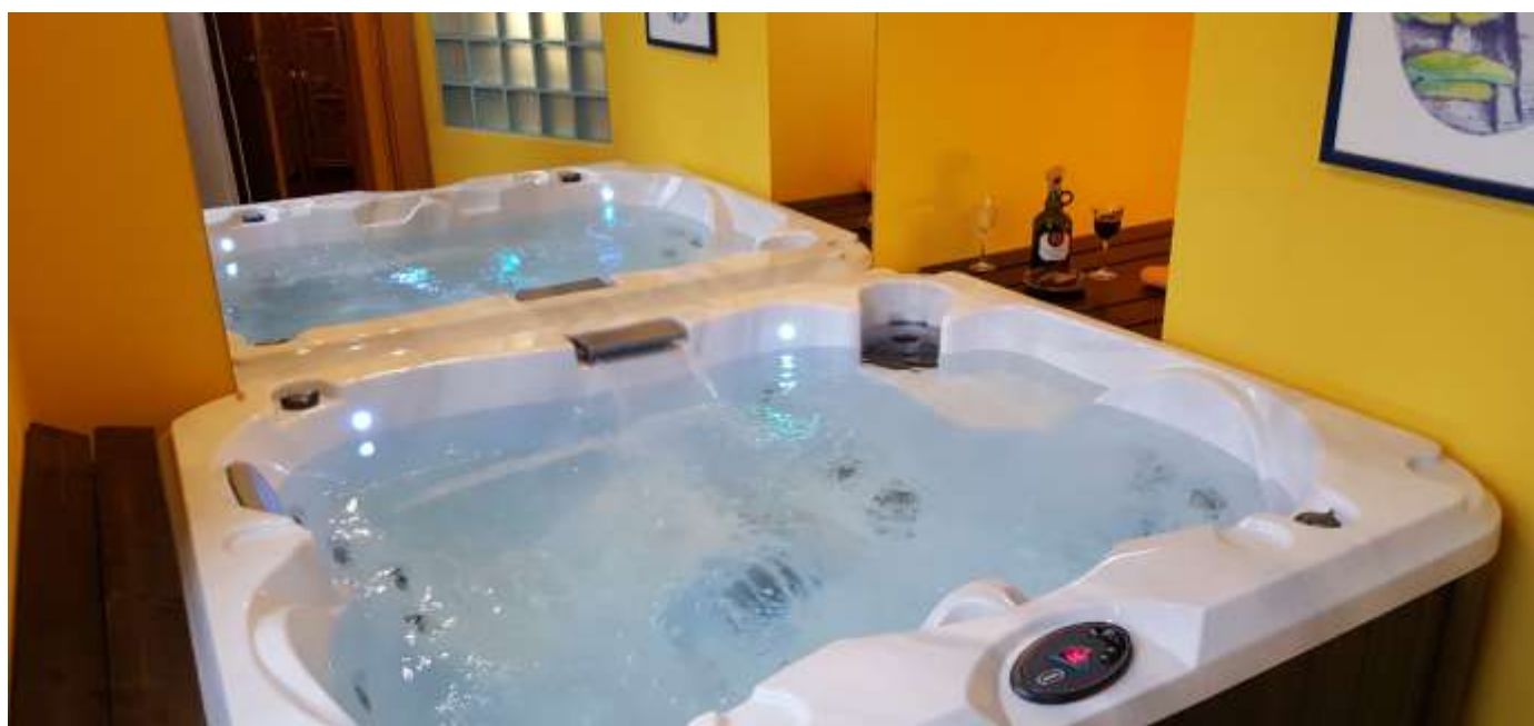
Studio Kapella Novum dla 2 osób, z mini-basenem Jacuzzi®, mini plażą i mini-kominkiem