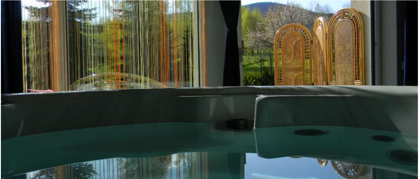
Apartament Andromeda, dla 2 osób, z mini-basenem Jacuzzi® (czterooosobowe okrągłe) i widokiem na Kopę Biskupią, sypialnia, aneks kuchenny, taras