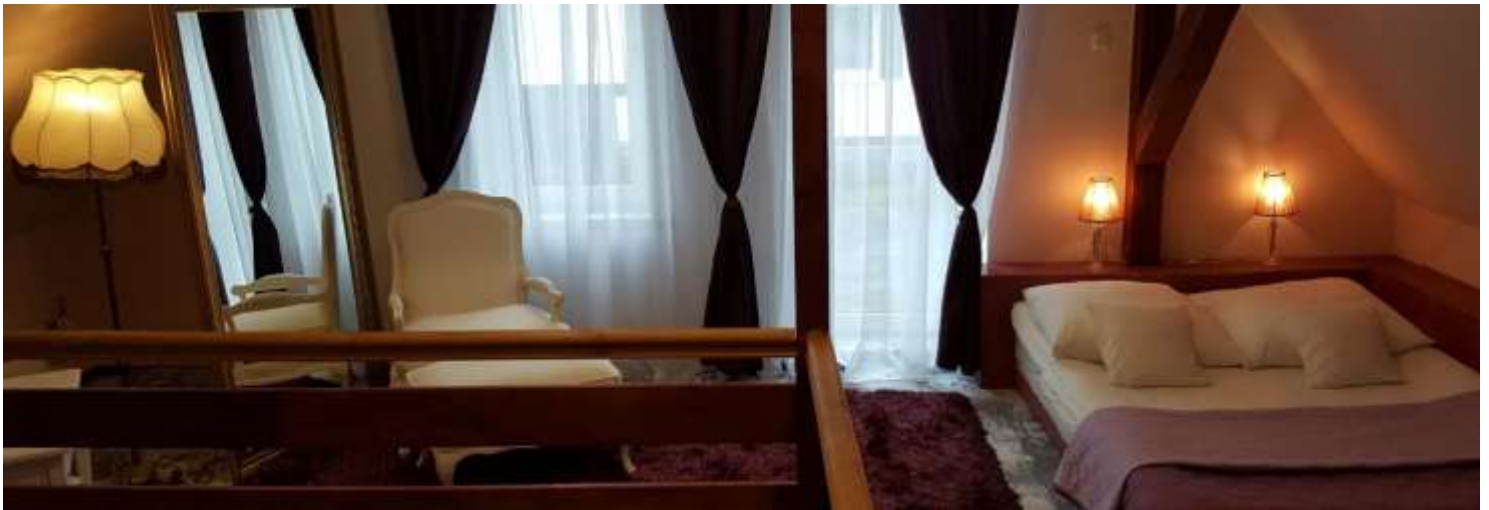
Apartament Luna dla 2 osób, z buduarową sypialnią na poddaszu, aneksem kuchennym, mini-basenem Jacuzzi® (4osobowym kwadratowy), kominkiem i tarasem na parterze.