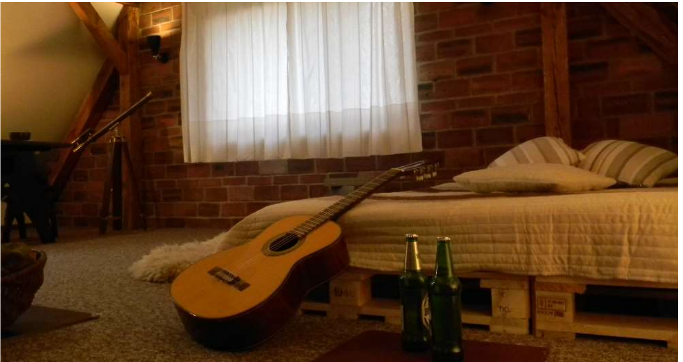
Apartament Orion dla 2 osób, kominkiem i aneksem kuchennym. Super wanna Alpha Jacuzzi® (2osobowa) – opcja na życzenie.