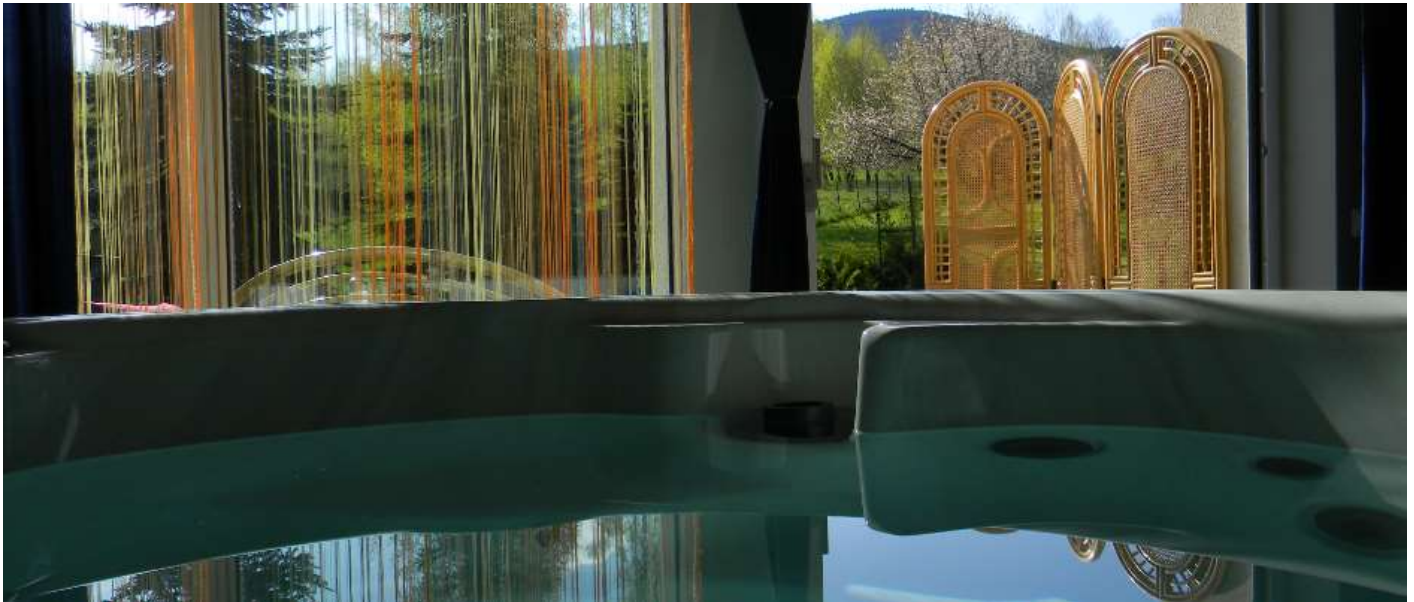
Apartament Andromeda, dla 2 osób, z mini-basenem Jacuzzi® (czterooosobowe okrągłe) i widokiem na Kopę Biskupią, sypialnia, aneks kuchenny, taras